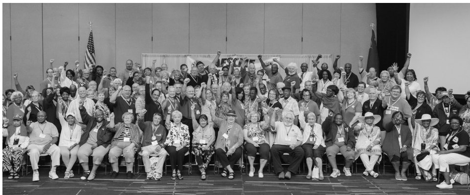
▲ ¡Los Jubilados de AFSCME nunca se rinden!

Líderes de los 41 capítulos de jubilados de AFSCME de todo el país realizaron su reunión anual este fin de semana para elegir a sus oficiales, aprender cómo proteger y expandir la Seguridad Social y Medicare, y prepararse para una elección en noviembre que impactará no sólo su seguridad en la jubilación sino la de sus hijos y nietos.